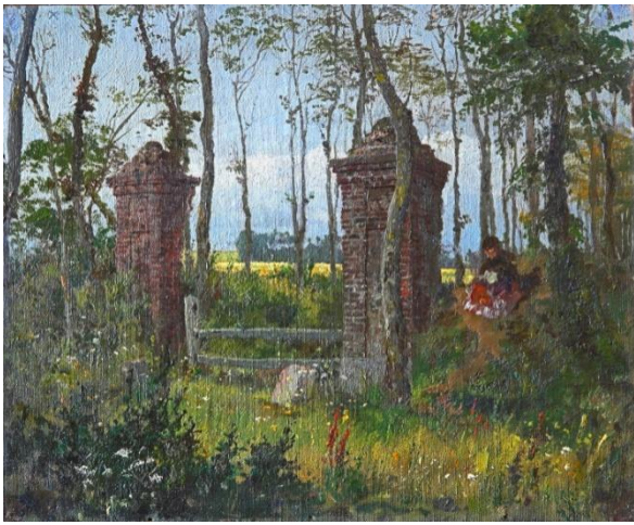
V.D. Polenov. Vieilles Portes à Veules. Normandie. 1874. Peinture à l'huile. 24x30 Etude pour le tableau «Au parc» 1874, exposé au Musée russe à Saint-Petersbourg