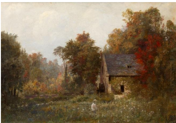
V.D. Polenov. Moulin à la source de la rivière de Veules. Etude. 1874. Peinture à l'huile. 38x55,5