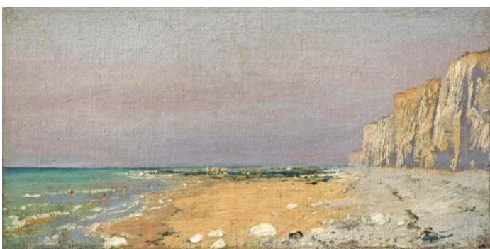
V.D. Polenov. Côte normande. Etude. 1874. Peinture à l'huile. 14,5x28,5